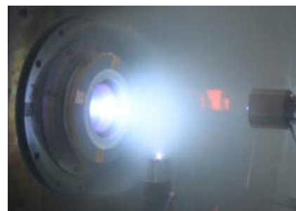
図2 エンジンから排出されるプラズマジェットの様子