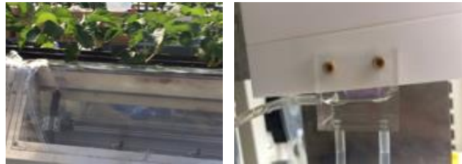
(a) プラズマ直接照射 (b) プラズマ照射溶液の調製