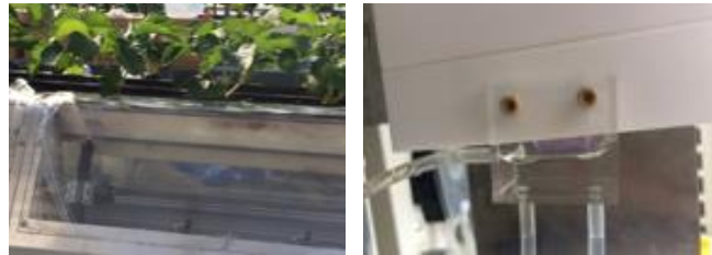
(a) プラズマ直接照射 (b) プラズマ照射溶液の調製