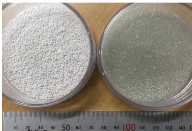
図 3 : \mu\text{m} サイズの \text{SiO}_2 粒子の凝集による階層粉体（左）およびガラスビーズ（右）（粒子直径はどちらも約 1 mm）

微小重力実験実施のためには，通常，大規模な落下塔や飛行機による自由落下飛行等が必要となるため，微小重力実験は大きなコストを要する場合がありますが，本研究で用いた実験室落下塔は低コストで微小重力実験を多数回行うことができます。実験室落下塔は規模が小さいため微小重力実現時間は限られたもの（約 0.5 秒）となりますが，衝突現象などの比較的高速な現象の実験のためには十分なものとなっています。本研究では，この実験室落下塔の特性を活かし，階層構造を持つ脆い粉体クラスターと稠密で堅いガラスビーズにより構成される粉体クラスターの両者（図 3）をターゲットとして，固体弾を用いた微小重力環境下での衝突実験を世界で初めて系統的に実施しました。得られた結果は，堅い粉体も脆い粉体も同じ膨張様式