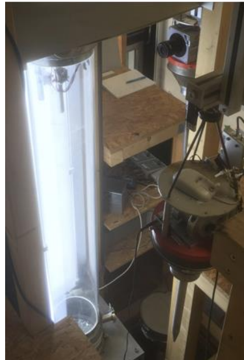
図 1：ブラウンシュバイク工科大学で開発された実験室落下塔

このような背景を受けて、ドイツ・ブラウンシュバイク工科大学の Jürgen Blum 教授の研究グループにより開発された高さ約 1.5 m の実験室落下塔（図 1）を用いた自由落下最中の粉体衝突実験（固体弾の粉体クラスターへの衝突）を行いました。落下塔内は真空・微小重力という宇宙空間を模擬した環境となっておりと同時に（空気抵抗や地球重力の効果などが無視できるため）粉体物理の理想的実験環境にもなっています。粉体を構成する粒子としては稠密なガラスビーズおよび高空隙率のダスト凝集体（階層粉体粒子）を用い、0.045-1.6 m/s の衝突速度範囲で系統的に条件を変化させて実験を行いました。衝突の様子を高速度カメラで撮影し（図 2）、画像解析により粉体クラスターの膨張の様子を解析しました。その結果、固体弾の衝突により誘発されるターゲット粉体クラスターの膨張動力学が粒子の階層構造には依らず、密度の違いを考慮することにより、全ての実験結果が同一のエネルギー分配法則（衝突エネルギー分配則 注4） で説明できることが見出されました。具体的には、衝