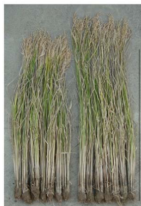
コントロール カサラスのGW6a遺伝子を導入したイネ

人類のエネルギー摂取に重要な穀類の収量増加を目指した取り組みは、世界中でいろいろな手法で多岐にわたりますが、数%を上昇させるのは大変なことです。今回、我々が見いだした