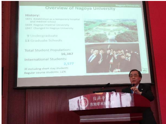
写真3：Beijing Forum2018でのプレゼンテーション