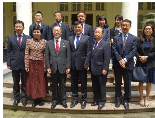
写真 11: 上海市政府メンバー、協定3大学メンバー、 星屋氏（名大工OB）と