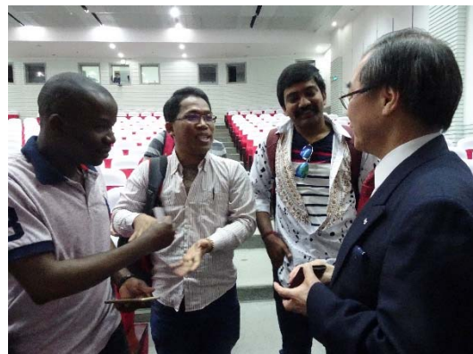
写真8：講演会終了後、留学生とともに