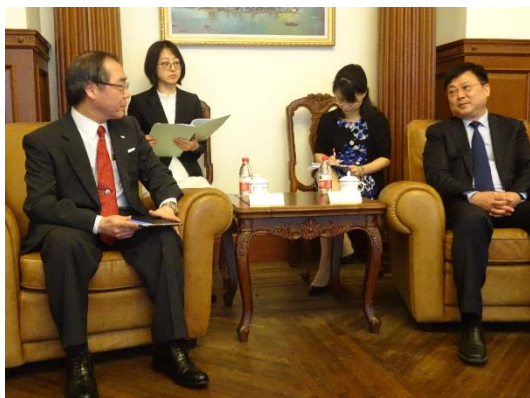
写真 10: 張小松主任との懇談

上海市における対外的な交流を所掌する上海市政府外事弁公室を訪問し、最高責任者である張小松主任と懇談をしました。懇談では、上海市内にある本学協定校の同済大学・復旦大学・上海交通大学との連携、上海市政府が目指す「卓越したグローバルシティ」「世界的に影響力のあるイノベーションセンター」について本学への協力依頼、上海市と本学との連携等について意見交換をしました。