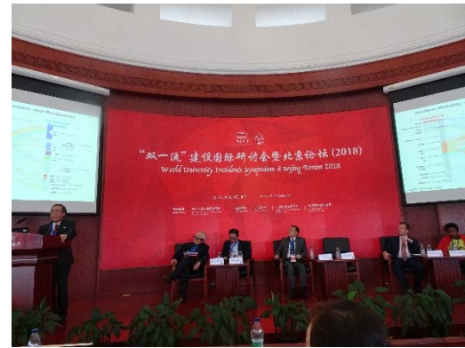
写真4：パネルディスカッション