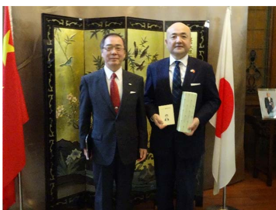
写真 12: 片山総領事とともに

駐上海日本国総領事館を訪問し、片山和之総領事と懇談をしました。懇談では、G30 プログラム、CALE、アジアサテライトキャンパス学院等の本学の国際的な取組、大学を取り巻く最近の状況、学生の国際化等、多岐にわたる話題について意見交換をしました。