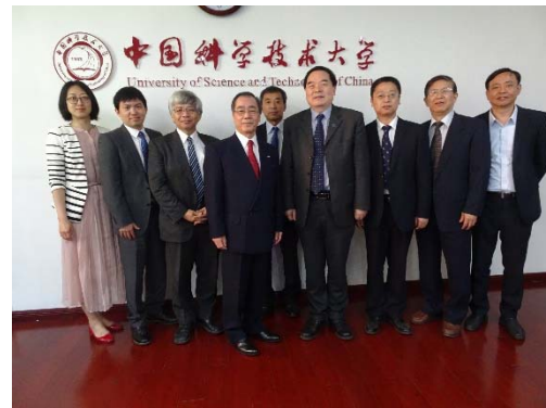
写真6：懇談メンバーと

学長との懇談に続き、West Conference Room HFNLにおいて特別講演会を行いました。この特別講演会には、留学生を中心に約50名の方に参加いただきました。講演では、本学を代表する研究グループ（ITbM、CIRFE、KMI）、教育面における国際化の状況、G30プログラム、アジアサテライトキャンパス学院及びCALEを中心としたアジア戦略、中国との交流状況、GaNコンソーシアム、NCC、COI等の産学官連携への取組、HeForSheに代表されるダイバーシティへの取組、今後、取り組むべき課題等について話しました。講演後の質疑応答では、本学情報学研