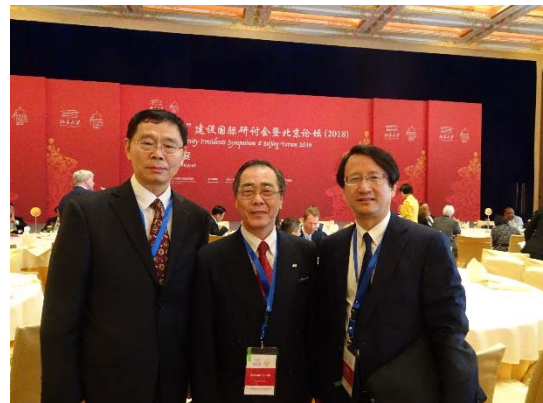
写真2：大連理工大学郭学長、浙江大学呉学長とともに

その翌日にはBeijing Forum2018と銘打ったパネルディスカッションが行われ、テーマ「Cross-cultural Exchange and Cooperation」のパネリストとして登壇しました。