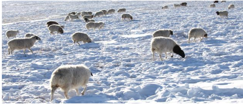
図1 冬のモンゴル草原における遊牧風景。家畜は雪の下に埋もれた枯草を食べているが、多雪の場合には採食が困難になり、餓死することもある。最も被害が大きいゾドのひとつは、このような多雪による「白いゾド」である。