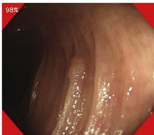
図 2. 実装済みソフトウェアのアウトプット