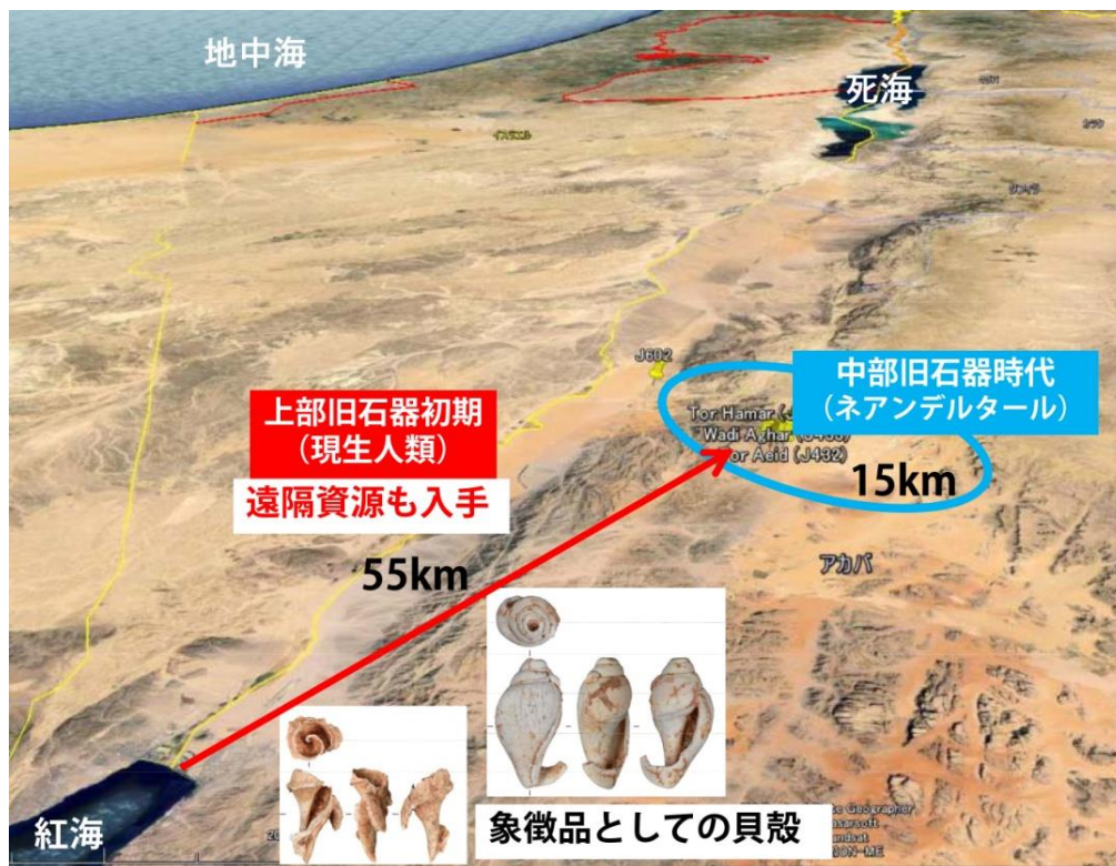
図4 レヴァント地方の内陸乾燥域におけるネアンデルタール人と現生人類の資源獲得行動の違い。現生人類の特徴は居住域から離れた異なる環境とのつながりがあり、それを示す小型貝殻という象徴品を用いていたこと。