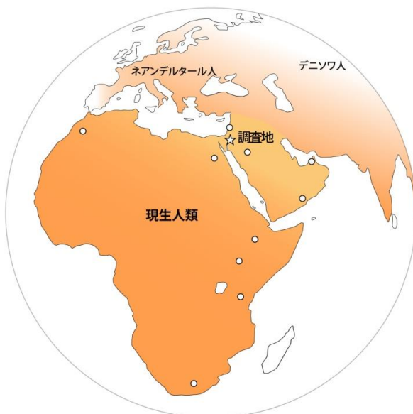
図 1 調査地☆は、現生人類が出現したアフリカに近いレヴァント地方(地中海東岸域)。ここにはネアンデルタール人も居住した。○は最古級の現生人類化石が発見された場所。

この丁寧な比較を行うために、本研究ではネアンデルタール人と現生人類の両方の遺跡が残る地域を研究対象としました。そうした地域はユーラシア大陸の一部に限られますが、その中でも現生人類の起源地であるアフリカに近く、しかも現生人類が新しい文化(上部旧石器文化 注4 )を早くから生み出した西アジア(特にレヴァント地方 注2 )が鍵になる予測し、2016 年から遺跡調査を開始しました(図 1)。