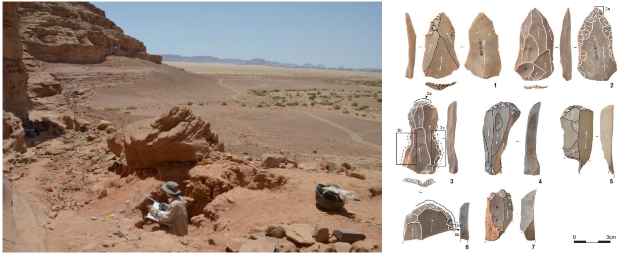
図2 ワディ・アガル遺跡（左図手前）と発掘された石器（右図）。レヴァント地方の内陸乾燥域において、ネアンデルタール人絶滅後に入植した現生人類が4万～4万5千年前に居住していた。狩猟具と思われる石器（1と2）の他に、皮革加工に用いられた石器（3～7）などが見つかった。

レヴァント地方の現地調査では、ネアンデルタール人が生存していた時代（中部旧石器時代 注3 ）の遺跡のほか、ネアンデルタール人が絶滅し現生人類のみが増加した時代（上部旧石器時代 注4 ）の遺跡を発掘し、石器などの考古標本を収集しました（図2）。調査地域はヨルダン国南部の内陸乾燥地帯です（地中海からは185 km、紅海からは55 km）。この地域は、現在の年間降水量が50 mm程度の砂漠地帯であり、狩猟採集の生活は不可能な過酷な環境です。旧石器時代は今より雨が多く、野生動物や植物が多かったことが分かっていますが、それでも海岸域に比べて乾燥した草原であったため、食料資源は限られていたと考えられます。