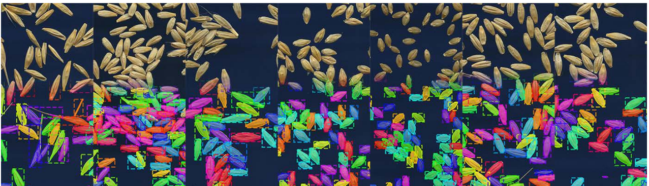
図1 インスタンスセグメンテーションによる様々な品種の種子の自動検出 （上部：入力画像、下部：本研究における検出結果）

近年、植物の表現型を計測する植物フェノタイピング 注2) 分野において、深層学習を用いた画像解析が盛んに用いられています。本研究では、深層学習によるインスタンスセグメンテーション 注3) を用い、1枚の画像から、数百粒の種子の形状を自動取得するシステムの開発を目的としています（図1）。