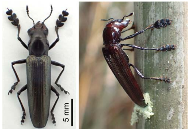
図1. ニホンホホビロコメツキモドキのメス背面（左）と竹に産卵中のメス（右）

ニホンホホビロコメツキモドキは、幼虫が竹の空洞で酵母菌を食べて育つ、日本固有種の昆虫です。メスの左側の大顎が顕著に発達し、一見して左右非対称なかたちをしています（図1）。メスは、左右非対称な大顎で竹をかじって空洞に達する穴を開け、空洞内に卵を一つ産みつけます（図1）。その際、同時に共生微生物である酵母菌も植えつけます。孵化した幼虫は、空洞表面で増殖した酵母菌を食べて成長し、一つの空洞内で成虫になります。一つの空洞で成虫になるのは必ず1頭のみで、なおかつ幼虫は節を貫通して隣の空洞へ移動することはありません。幼虫の限定的な餌量と低い移動能力から、ニホンホホビロコメツキモドキの産卵痕も産卵抑制効果を持つ可能性が考えられました。