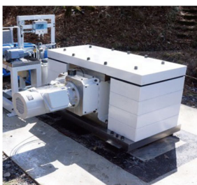
図1. 小型連続震源装置の写真。約1mの大きさ。連続的に発振した振動を足し合わせることで、シグナルを強調できる。

本研究成果は、2021年9月27日に国際誌「Scientific Reports」に掲載されました。