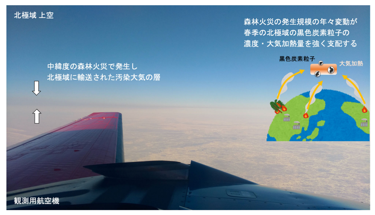
図 2. 2018 年の航空機観測 (PAMARCMiP) 時に機内から撮影された写真。汚染大気の層が見られた。模式図は中緯度から北極域に輸送される BC を表す。

った 2008 年と 2015 年は数値モデルが観測より明らかに小さな値となることが分かりました。このシミュレーションは、名古屋大学と気象研究所の 2 つの異なる数値モデルを用いて実施され、いずれも同様の傾向の結果が得られています。これは、現在の数値モデルは人為起源の BC の寄与をおおむね良く再現できているのに対し、森林火災起源の BC の寄与を大幅に (3 分の 1 程度に)過小評価していることを示しています。