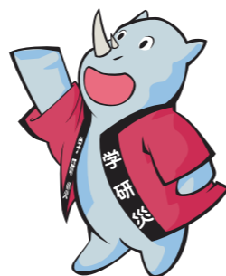
学研災キャラクター サイチャン