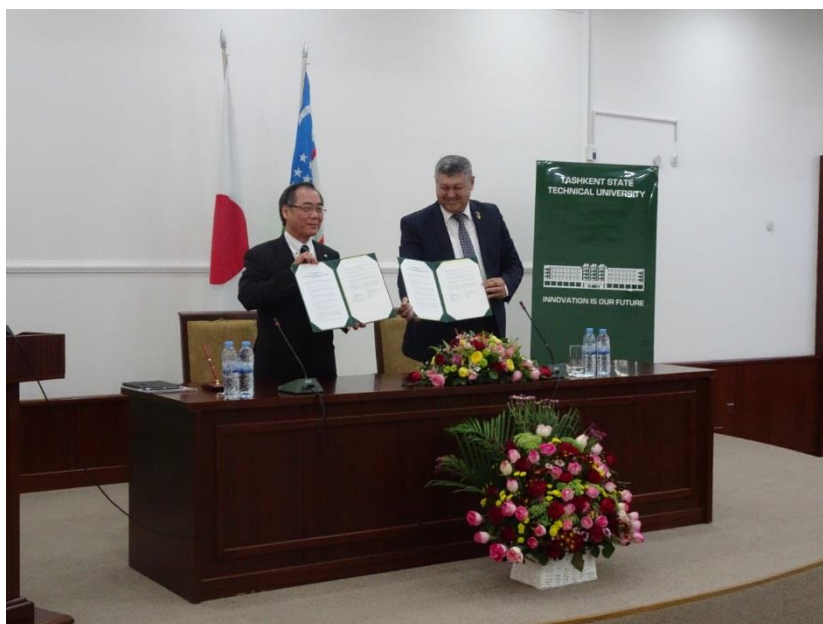
トゥラブジャノフ・タシケント工科大学長と

これまで、本学とタシケント工科大学とは、イノベーションセンター設立を通じた人材育成支援における交流実績があり、今回は「学生交流に関する覚書」を締結することができました。