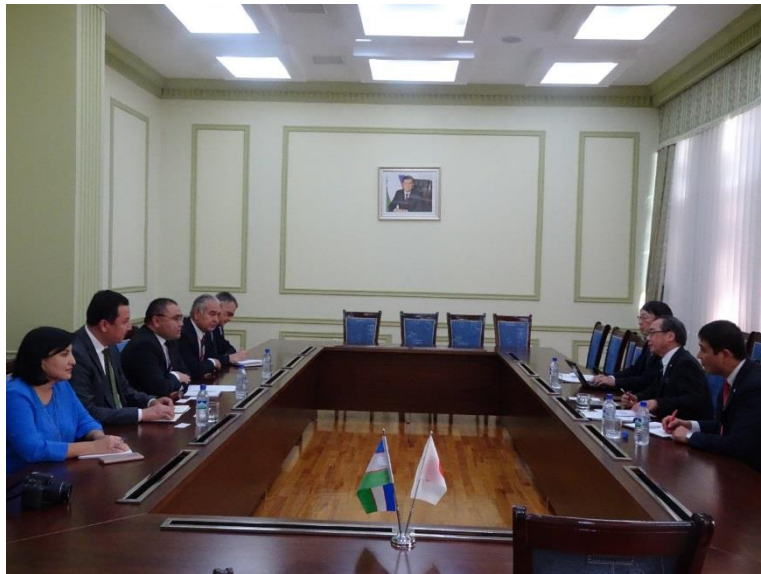
アブドラフマノフ・イノベーション開発大臣らとの懇談

アブドラフマノフ大臣との懇談では、先方からはウズベキスタンのイノベーション戦略や科学の商業化、人材育成等について話がありました。私からはイノベーションについて、政府の GSTI（総合科学技術・イノベーション会議）で、私自身、非常勤議員として、毎週、協議をしているが、カバーする分野が多いこと、安倍総理のウズベキスタン訪問を契機とした名古屋大学によるウズベキスタンでの活動や、野依特別教授の講演会について紹介しました。