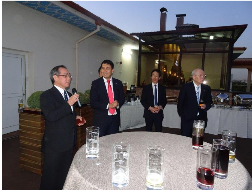
名古屋大学全学同窓会ウズベキスタン支部での同窓会のひととき