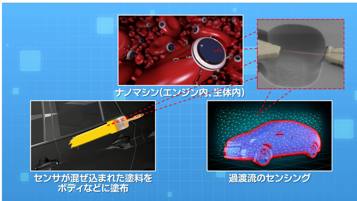
図：超小型アンテナを用いた様々なセンサーや検出応用のイメージ

従来のセンサーでは、情報検知・受信を司る「アンテナ」の大きさが、受信する信号（電磁波）の波長によって決まっていました。これは受信信号をアンテナが直接、電気的な信号に変換するためです。今回の研究では、機械的に振動するアンテナを利用して電磁波を検知する技術に着目しました。これは受信信号を機械振動に変換してから、電気信号に戻す技術です。機械振動子アンテナに、高い機械強度と優れた電気特性を持つカーボンナノチューブを用いることで、従来では数 m～数 cm という大きさが必要なアンテナをナノスケールにまで小型化しました。さらに本研究では、作製したナノアンテナとデジタル通信技術を組み合わせることで、ノイズのある環境下でも、極微小のアンテナでカラー画像のような大きなデータを通信することが可能であることを実証しました。本研究の成果は、様々な信号検出に応用可能であり、生体内や大気中の情報など、これまで不透明だった様々な情報を直接的に検出できる可能性を秘めています。