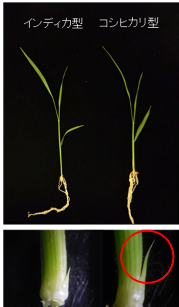
図 1. インディカ型とコシヒカリ型 MP3 の腋芽伸長の様子

コシヒカリ型 MP3 を持つ品種は、幼苗の段階で腋芽の伸長がインディカ型 MP3 よりも旺盛であることが分かります (図中○印)。