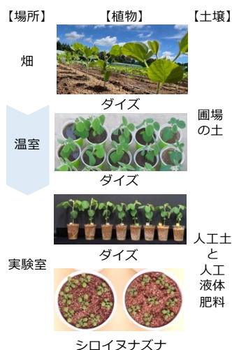
図 2. 畑と実験室、モデル作物とモデル実験植物を組み合わせた、畑の干ばつストレス応答機構の解明に向けた取り組み

高さ 30 cm の畝を用いることにより、畝区では土壌水分が通常区よりも減少し、ダイズの生育や収量が顕著に低下します。左図は、播種後 56 日目のダイズの生育状況を示しています。試験区に設置した土壌水分センサーの情報は、黒いケーブルを通して白い箱の中にある記録装置に蓄積されており、試験区内の土壌水分の経時的なモニタリングを行っています。右図は、それぞれの試験区で育った収穫時のダイズの様子と収穫したダイズ種子を示しています。この場合でもダイズの収量は、およそ半分程度になっています。しおれが見られない程度の「見えない干ばつ」においても、作物生産に大きなダメージを与えていることがわかります。実験場所は、茨城県つくば市です。